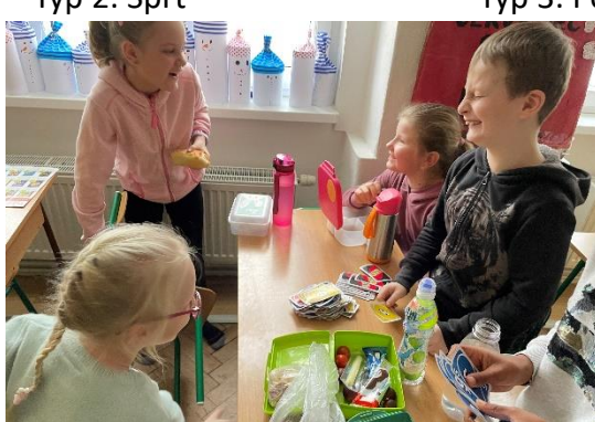
Typ 5: Karbaníci