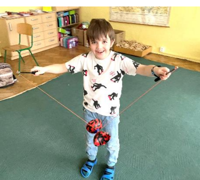
Typ 1: Kejkliř

Přestávka je ta kouzelná pauza ve vyučování, kdy se může každý zabavit podle svého gusta. Přinášíme vám komentovanou fotoreportáž o tom, jak různé typy a různí týpci tráví tento drahocenný čas.