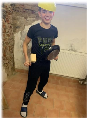
Master Chef Retard