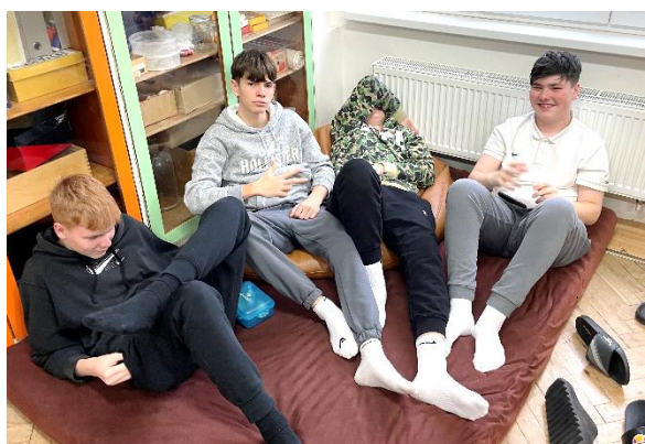
Typ 3: Povaleči