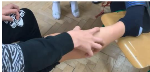
A už si to hladí.