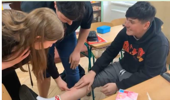
No jo, je to hladký!