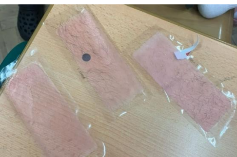
To jsou ty jejich chlupy.