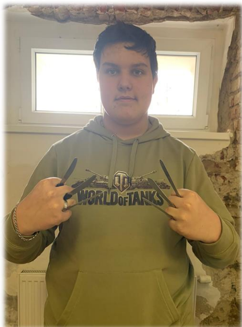
Bez příboru se nenajíš. Takže radši víc.

Do té doby si musíte vystačit se fotoeditorialem našich příčinlivých redaktorů.