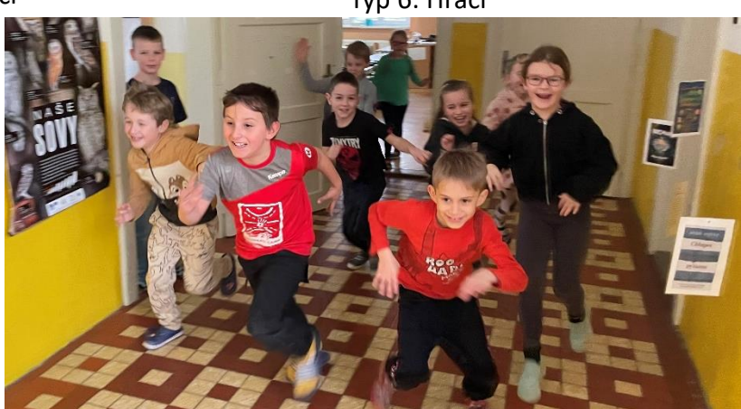
Typ 8: Běžci