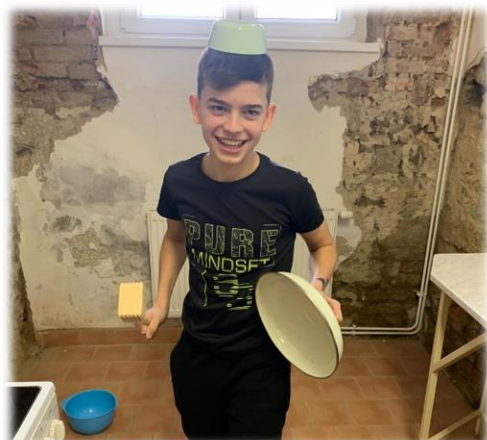
Takové foto by chtěl mít každý. Na nočním stolečku.