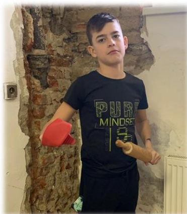
Já klidně můžu. Co vy?