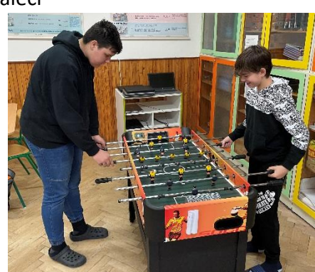
Typ 6: Hráči