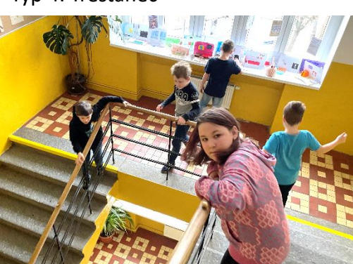
Typ 7: Zevlanti