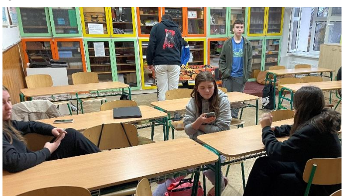
Typ 10: Obyvatelé Matrixu