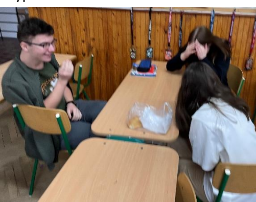
Typ 9: Drbny