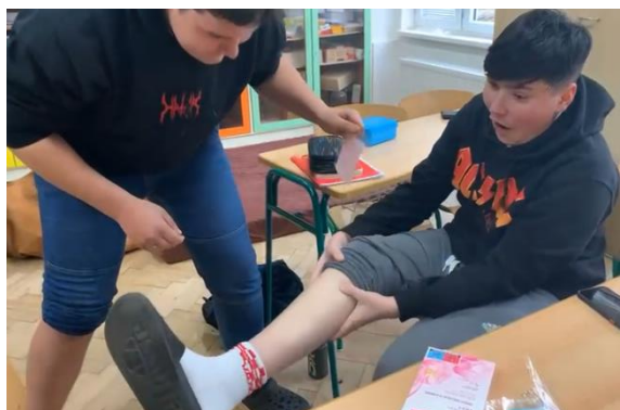
Těsně po stržení. To byste nechtěli slyšet.