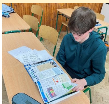
Typ 2: Šprt