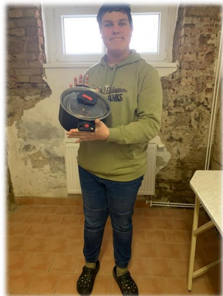
Dominik vypadá jak nakreslenej. Ale není.