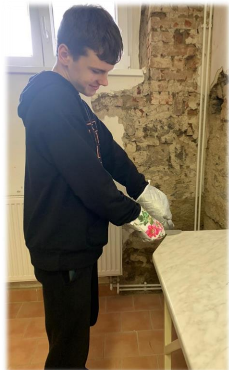
Není to takové psycho , jak se zdá. Fakt nekrájí tu desku, věřte nám. A všimněte si slušivých chňapek .