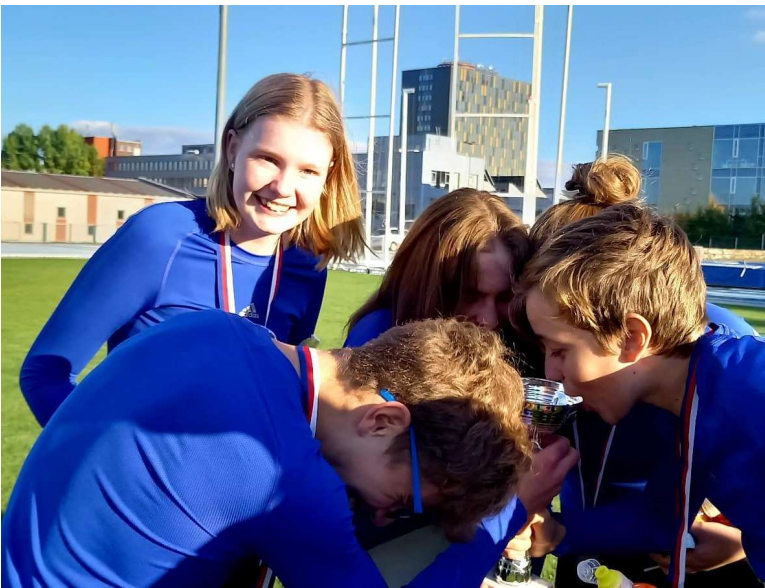
Sice jsme nevyhráli úplně všechno, ale máme nejhezčí holky!

A jak skončil náš mladší tým? Všechny disciplíny se jim moc povedly, a tak se umístili druzí!